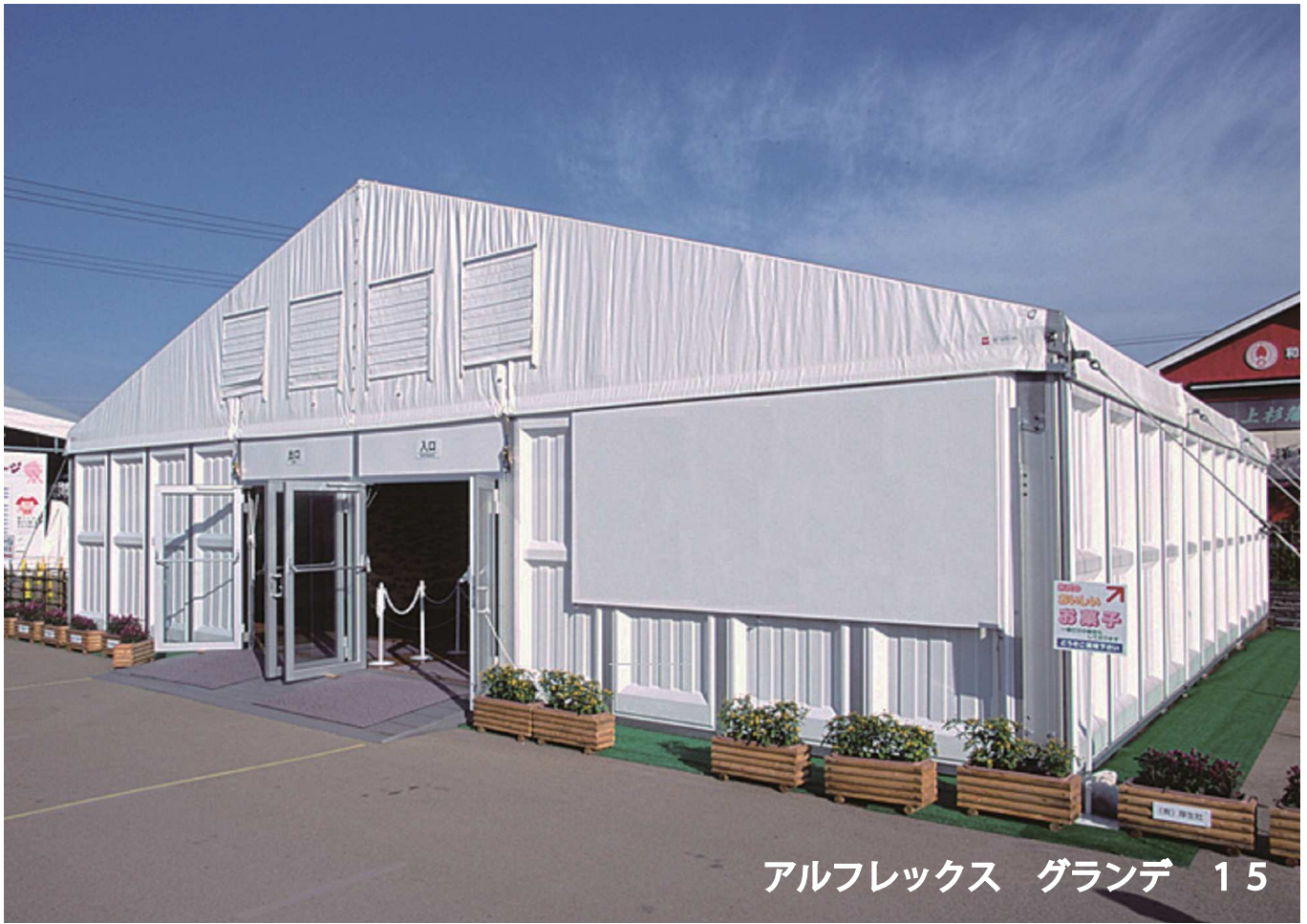
アルフレックス グランデ 15