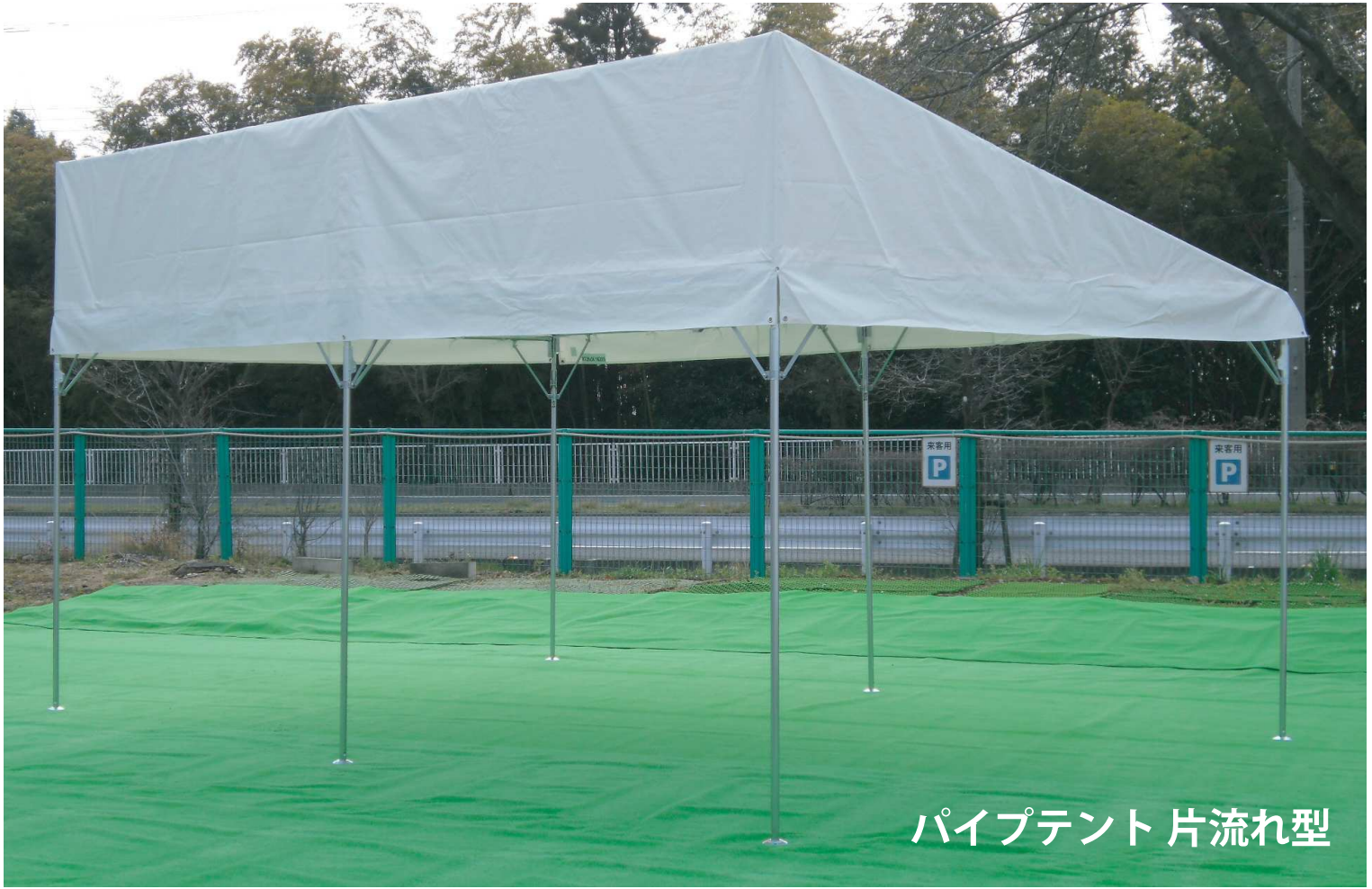
パイプテント 片流れ型